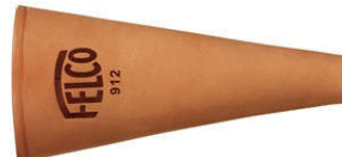
FELCO 912 Övtok Bőr, övre csiptethető