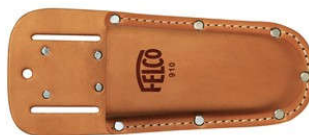
FELCO 910 Övtok Bőr, övre fűzhető